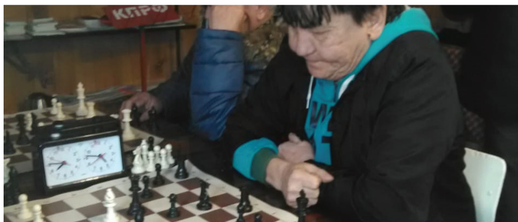
Из архива АРО КПРФ

В Турочакском райкоме доброй традицией уже стало проведение турнира по шахматам.