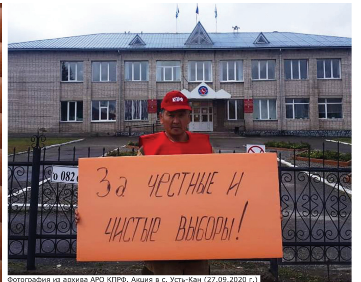
Акция в с. Усть-Кан (27.09.2020 г.)