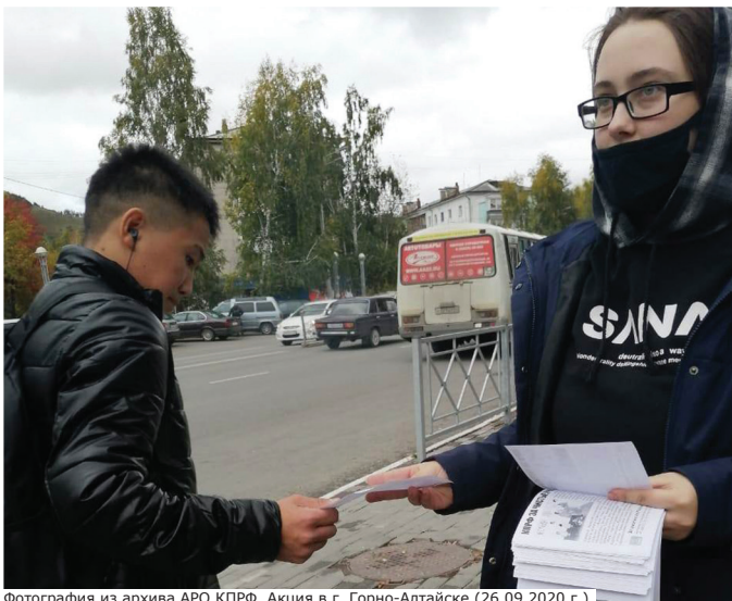
Акция в г. Горно-Алтайске (26.09.2020 г.)