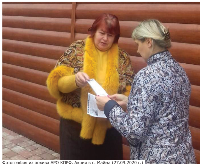
Акция в с. Майма (27.09.2020 г.)