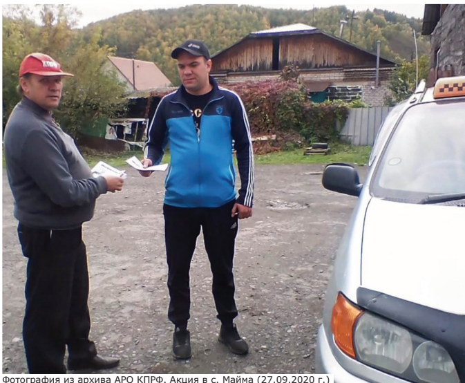
Акция в с. Майма (27.09.2020 г.)