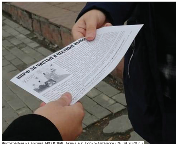
Акция в г. Горно-Алтайске (26.09.2020 г.)