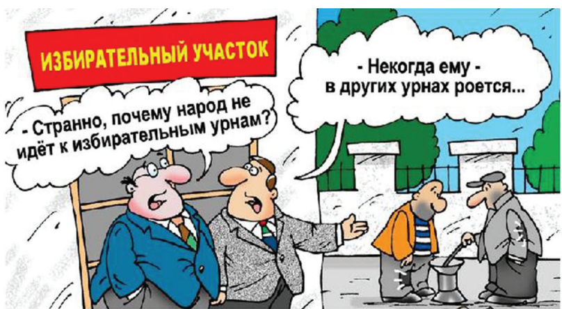
Карикатура с сайта caricatura.ru