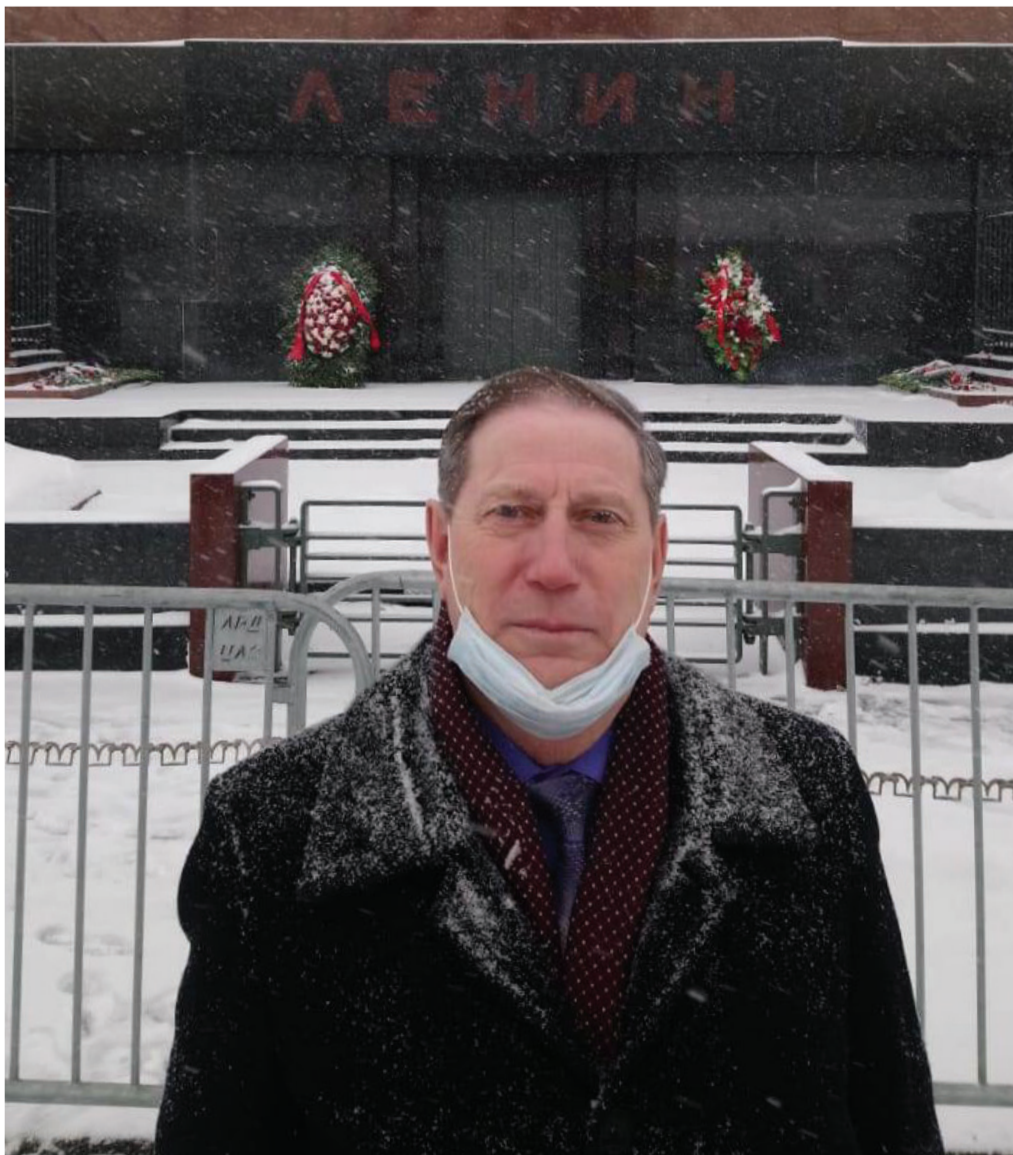
Г. Москва, Красная площадь, у Мавзолея Ленина

21 января 2021 года коммунисты Республики Алтай почтили память основателя Советского государства В.И. Ленина.